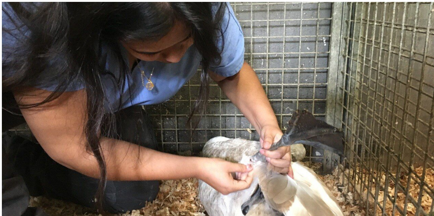
Décroché facilement du bec, le leurre de pêche a blessé le cygne à la patte.

Pour éviter la mort d'autres animaux, le collectif du lac de Créteil demande aux pêcheurs de faire des efforts. « Notre but n'est pas d'interdire ce loisir , indique l'association. Il faut juste récupérer les déchets de pêche et les jeter dans une poubelle. »