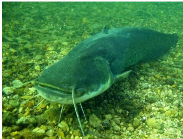
L'un des silures glanes de l'étang de la base de loisirs de Cergy-Pontoise. © André Mahé

Le silure glane est le plus gros poisson d'eau douce d'Europe. Il peut dépasser en France les 2,50 mètres de long et peser plus de 100 kilos. Originaire d'Europe de l'Est et introduit en France en 1857, il est présent maintenant dans tous les bassins hydrographiques de notre pays. C'est un carnivore qui consomme beaucoup d'écrevisses invasives et de coquillages. Les tortues de Floride et les poissons sont aussi à son menu. Lorsqu'il est de belle taille, il peut aussi consommer des oiseaux : des canards et même des pigeons comme le montre cette vidéo étonnante : http://www.francetvinfo.fr/decouverte/video-les-silures-d-albi-ont-trouve-de-nouvelles-proies-des-pigeons_184607.html