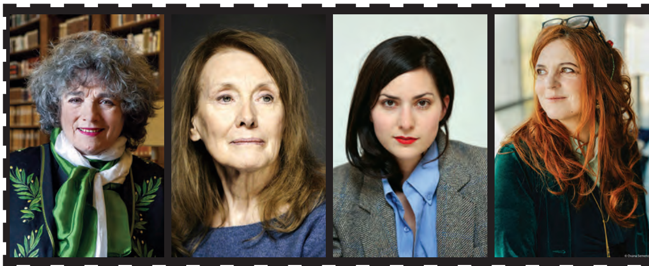
Coline Serreau, Annie Ernaux, Rebecca Zlotowski et Agnès Jaoui animeront ce 45 e Festival international de films de femmes.

Du 24 mars au 2 avril, le Festival international de films de femmes de Créteil soufflera sa 45 e bougie! Au programme, des courts et longs métrages, dont des fictions et des documentaires internationaux, des conférences abordant les conditions des femmes dans le monde et de grands noms du cinéma, comme Agnès Jaoui, Coline Serreau, Rebecca Zlotowski, ou encore Annie Ernaux. Un événement à ne pas manquer !