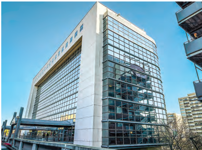
Le tribunal de commerce de Créteil.

Le Val-de-Marne est un territoire dynamique. D'ailleurs, en dépit des crises, sur 690 procédures collectives ouvertes, plus d'entreprises ont été créées que dissoutes en 2022. Ces chiffres représentent 31% de progression depuis 2021, mais restent inférieur de 25% à l'année de référence 2019. Le système de protection mis en place