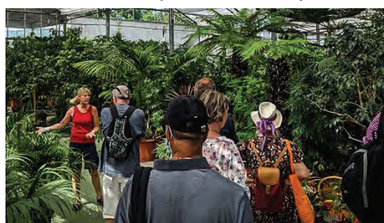
Visite des serres de Mandres-les-Roses.