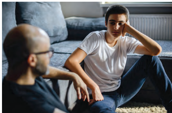
Le soutien à la parentalité sera favorisé avec des sensibilisations sur des sujets touchant au bien-être global de l'enfant.