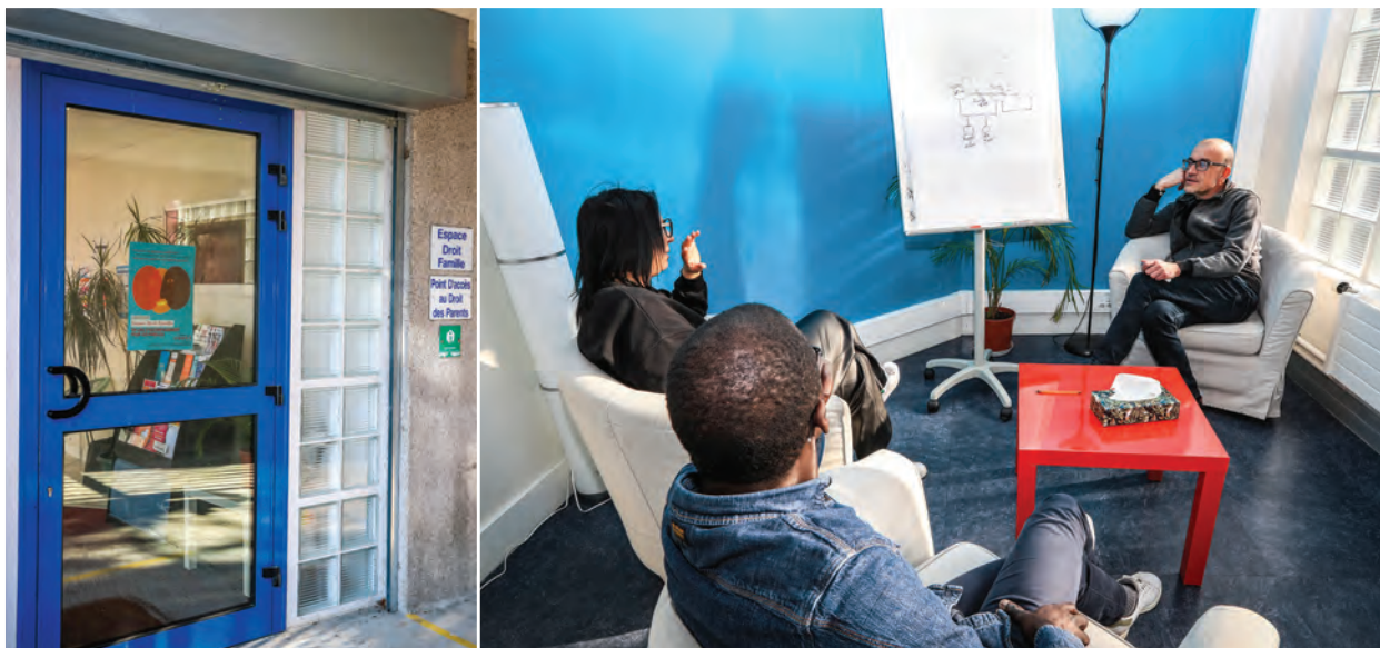
L'association est installée dans les locaux de l'ancien centre des impôts dans le quartier de la Habette.

Pour soutenir les parents dans leurs responsabilités familiales, prévenir les blocages ou guider leur résolution, l'association Espace droit famille répond depuis plus de 20 ans aux besoins d'information et d'accompagnement des Cristoliens dans les domaines de l'éducation, de l'exercice de l'autorité parentale, des conflits intrafamiliaux ou des difficultés psychologiques.