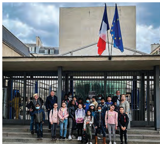
Visite du Mémorial de la Shoah avec le conseil municipal des enfants.