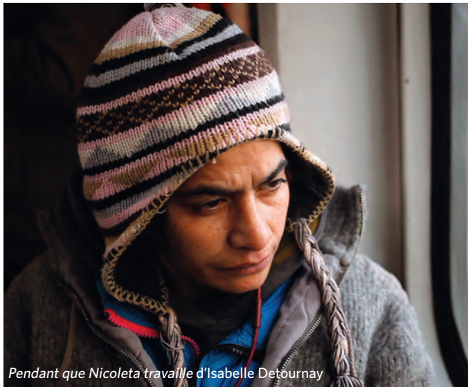
Pendant que Nicoleta travaille d'Isabelle Detournay

→ L'arrivée en force de nouvelles générations de réalisatrices dans le septième art, à partir des années 1990.