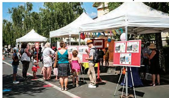
Stand des conseils de quartier lors de "Rue aux enfants".