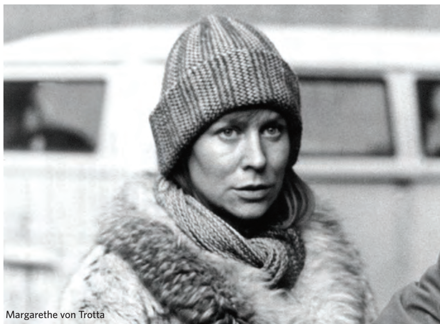
Margarethe von Trotta

La Lucarne s'associe au Festival international de films de femmes. Le cinéma du Mont-Mesly comptera à l'affiche 17 films signés par des femmes, répartis en 4 thématiques :