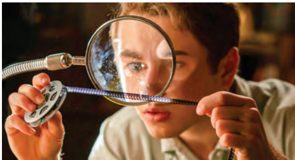
The Fabelmans de Steven Spielberg

Centre commercial du Palais | Tél. : 01 42 07 60 98 | www.lepalais.com