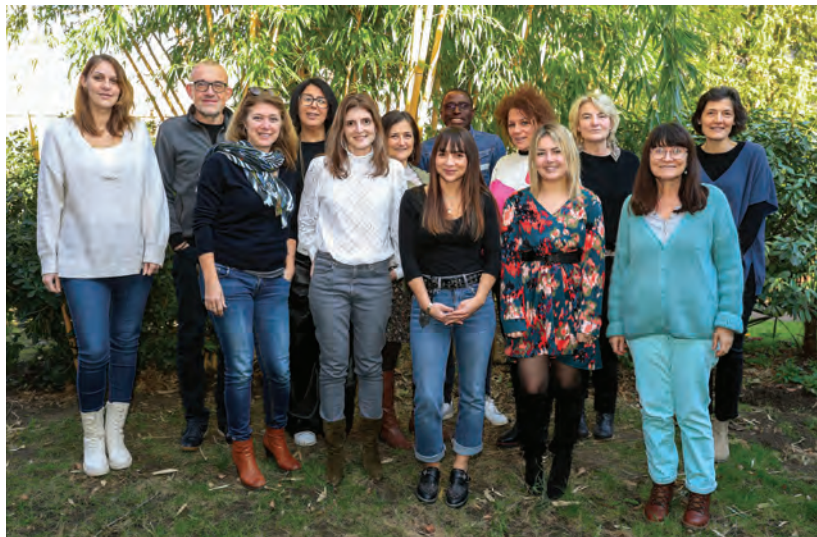
Une équipe pluridisciplinaire riche pour accompagner les familles cristoliennes.

Au moment d'une séparation, dans un contexte de conflit familial ou face au mal-être d'un proche (conjoint, enfant), les personnes qui se sentent débordées par la situation, qui sont en grande souffrance et ont le sentiment que les réponses habituelles