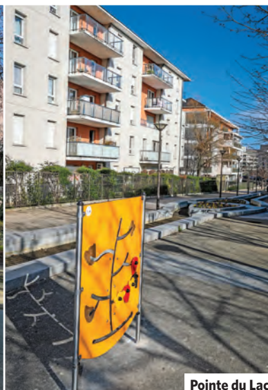
Pointe du Lac