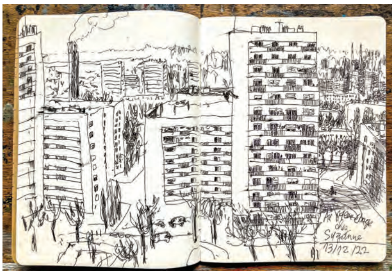
Croquis de recherche réalisé depuis le 14 e étage, chez Suzanne, au Mont-Mesly.

Associer des artistes à la création des 68 nouvelles gares du réseau du Grand Paris express (GPE), telle est la bonne idée de la Société du Grand Paris (SGP), qui a lancé à cet effet un appel à candidatures en mai 2021. Trente premiers artistes ont ainsi été sélectionnés pour réaliser des fresques sur les quais des gares prochainement desservies par les nouvelles lignes de métro, dont ceux de la station Créteil L'Échat, qui accueillera bientôt la ligne 15. Baptisé "Illustrer le Grand Paris", ce dispositif permettra ainsi de mettre en valeur des artistes issus de la bande dessinée, de l'illustration, du graphisme, ou encore du cinéma d'animation. Complémentaires aux œuvres "Tandems artistes/architectes" réalisées dans chacune des gares, ces illustrations bénéficieront d'une forte visibilité et constitueront la première image culturelle du GPE. Ces fresques pé-