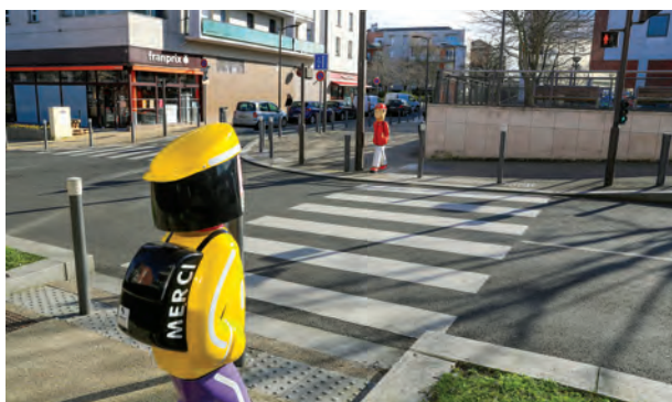
Concertation sur l'apaisement des circulations.

Dans le cadre de la démarche d'apaisement des circulations routières aux abords des établissements scolaires, les conseillers de quartiers ont enrichi les propositions des services de la Ville. En 2021, la "Rue aux enfants", initiative organisée par le conseil municipal des enfants, avait également été l'occasion pour les conseils de quartier