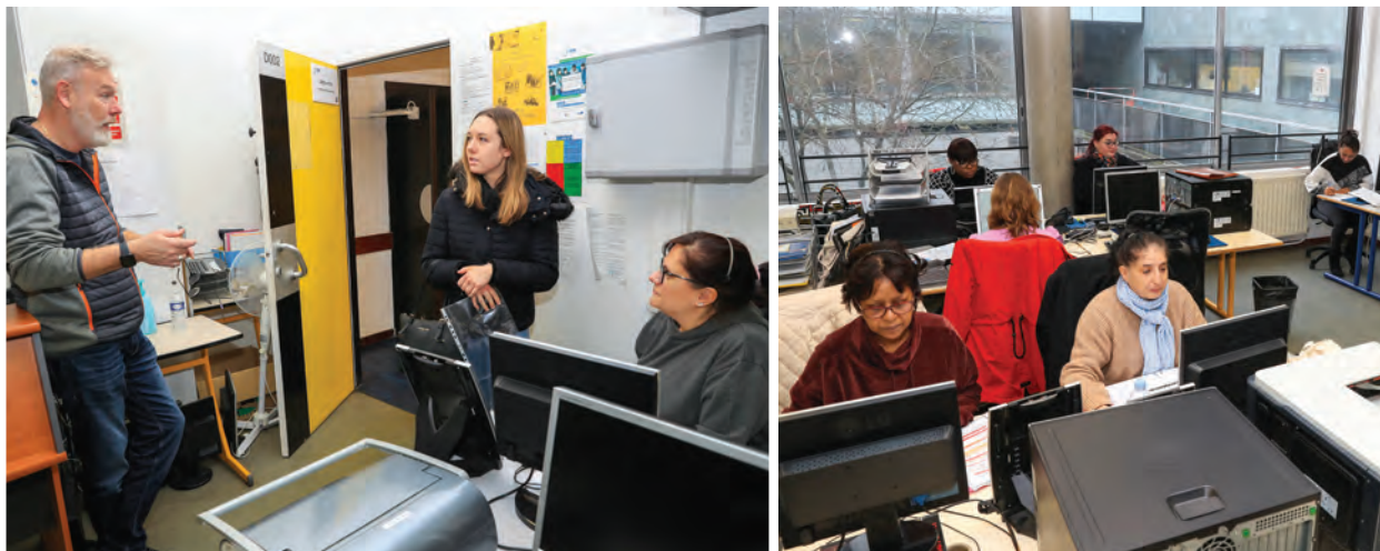
Le centre Greta du lycée Saint-Exupéry, spécialisé dans le secrétariat et la gestion-comptabilité, forme des salariés et demandeurs d'emploi depuis 1988.

À Créteil comme partout en France, les Greta sont implantés dans les établissements de l'Éducation nationale et répondent aux besoins de professionnalisation tout au long de la vie des salariés, demandeurs d'emploi et jeunes en insertion professionnelle.