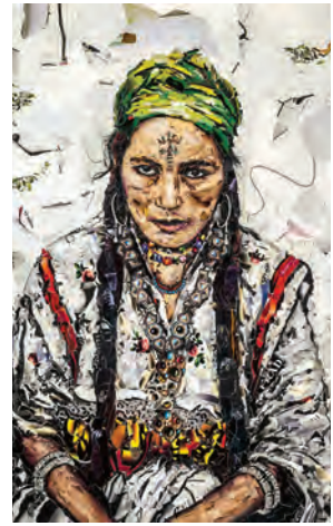
Tamazgha, de Mustapha Boutadine

À l'occasion de la Journée internationale des droits des femmes, l'association Filles et Fils de la République présente à la galerie Buzz'art l'exposition "Femmes debout !" de Mustapha Boutadine, dont Gisèle Halimi disait qu'il "célèbre les Algériennes qui se sont battues hier pour l'indépendance de leur pays et, aujourd'hui, pour faire progresser l'égalité entre les femmes et les hommes." Le vernissage aura lieu mardi 7 mars, à 18h30, en présence de l'artiste.