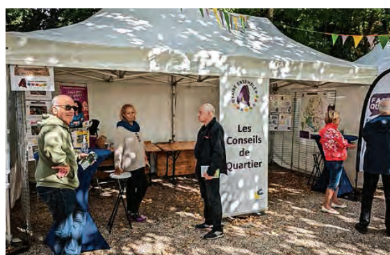
Stand des conseils de quartier lors de Parcs et jardins en fête.