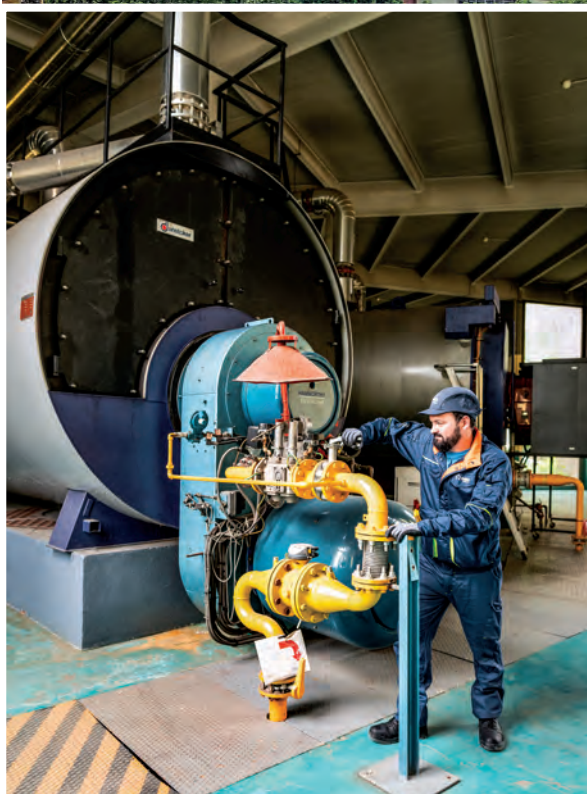
La réseau de chauffage urbain de la ville est alimenté à 68 % d'énergies renouvelables et de récupération.

Véritable levier de la transition énergétique du territoire depuis sa création en 1970, le réseau de chauffage urbain de Créteil tend de plus en plus vers le verdissement de son mix énergétique. Actuellement alimenté à 68% d'énergies renouvelables et de récupération issues principalement de la géothermie et de l'incinération de déchets ménagers, ce réseau s'inscrit dans l'engagement écologique et économique de la municipalité. Ainsi, 40 505 équivalents logements sont raccordés et bénéficient de cette énergie renouvelable, décarbonée et locale avec un prix stable garanti dans la durée.