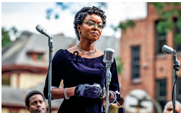
Emmett Till de Chinonye Chukwu