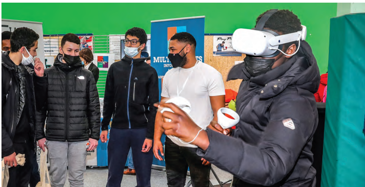
Les jeunes pourront découvrir des métiers grâce aux casques de réalité virtuelle.

Les filières en lien avec le numérique représentent une source d'emploi extrêmement importante pour les décennies à venir. Pour aider les jeunes Cristoliens dans leur orientation scolaire, le Bureau information jeunesse organise la deuxième édition du forum des métiers du numérique, mardi 14 mars, au centre Dassibat.